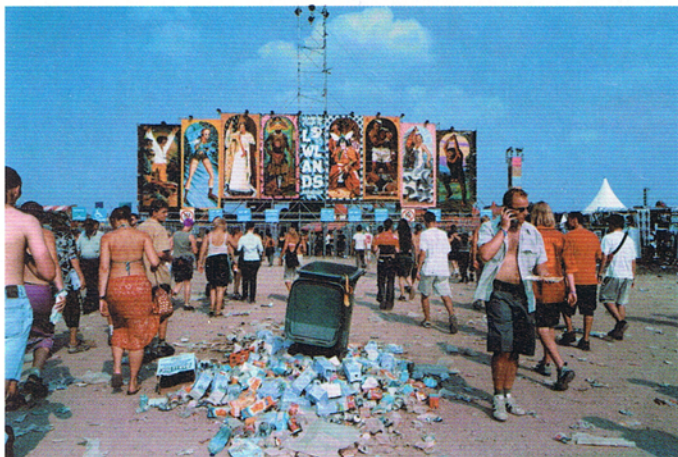
links Pret! Leisure en landschap. onder Campus TU Delft, Mecanoo Architecten, 2001.

van belevenisarchitectuur? Dertig jaar geleden publiceerden Robert Venturi en Denise Scott Brown de invloedrijke studie Learning from Las Vegas , waarin ze de nadruk leggen op het belang van de populaire cultuur en van de commercieel geïnspireerde architectuur van Las Vegas als bron voor serieuze architectuur. Wellicht kan een volgende pret-studie dieper ingaan op de gevolgen van deze commercialisering voor de vormgeving van de amusementsarchitectuur zelf.